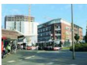
Kreisverkehr Fuhsbüttler Straße/Pestalozzistraße