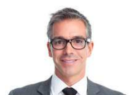
E-Book: Geheimnisse des Messevertriebs