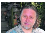
Abschied vom Landhaus Walter