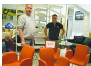
Möbelkiste mit neuem Konzept