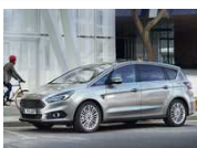
Der Ford S-Max