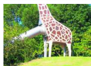
Dschungel-Spielplatz fast fertig